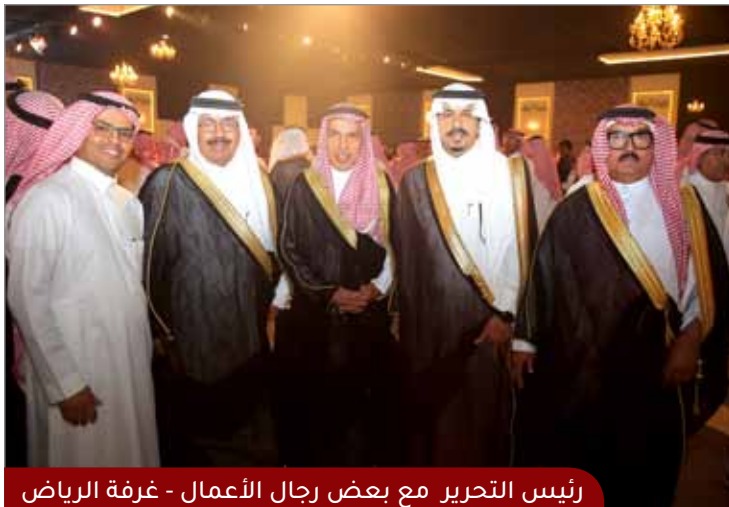
رئيس التحرير مع بعض رجال الأعمال - غرفة الرياض

وتضمن الحفل تدشين مبادرة مجلس التجار، التي تعد إحدى مبادرات اللجنة التجارية في الغرفة، وتستهدف إيجاد فاعلية تسهم في توثيق التواصل وإتاحة المجال للتعاون والآراء حول كل ما يتعلق بالقطاع التجاري، حيث يهدف المجلس إلى مناقشة التحديات والصعوبات في القطاع التجاري، وطرح قضايا الملحة بكل وضوح أمام المسؤولين وصناع القرار، واقتراح آليات للشراكة بين القطاع الحكومي والقطاع الخاص، وإيجاد أرضية مشتركة لتنفيذ برامج ومبادرات تجارية مهمة تسهم في تسهيل وتيسير أعمال القطاع.