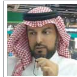
الأمير عبدالله بن عياف: 100 فرصة استثمارية.. والشباب ورواد الأعمال يمثلون أغلب المستثمرين

الخاص والبلدي، مضيفاً أن الأمانة تطرح سنوياً فرصاً كثيرة لكن المشاركة هنا، اقتصر على فرصتين فقط، من أصل ٢٥٠ فرصة.