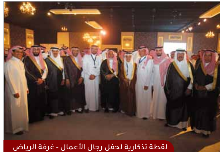
لقطة تذكارية لحفل رجال الأعمال - غرفة الرياض