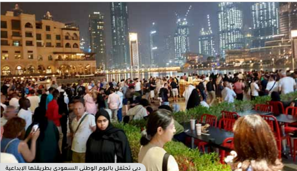
دبي تحتفل باليوم الوطني السعودي بطريقها الإبداعية