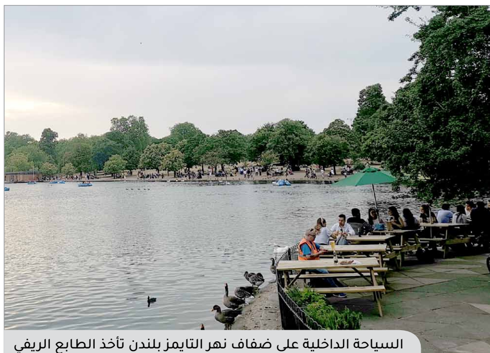
السياحة الداخلية على ضفاف نهر التايمز بلندن تأخذ الطابع الريفي

شركة معارض الرياض المحدودة، الشركة المنظمة للمعرض،: « يأتي انعقاد «معرض البناء السعودي ٢٠١٩» في الوقت الذي تشهد فيه المملكة نشاطاً إنشائياً لافتاً لا سيما ضمن القطاعات الصناعية والتجارية، بالتزامن مع «برنامج التحول الوطني ٢٠٢٠» و «رؤية المملكة ٢٠٣٠» وهو ما يعزز دوره كجوة مباشرة للوصول إلى الفرص الواعدة والأفاق الهائلة المتاحة أمام المستثمرين الراغبين بمواكبة ركب المنافسة والدخول بقوة إلى السوق السعودية التي من المتوقع أن ترضح ٣,٥ مليار دولار في الطرق والجسور خلال العام الجاري.