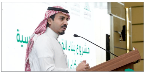
الرياض - متابعات

أطلقت وزارة الإسكان، بالتعاون مع وزارة العمل والتنمية الاجتماعية، مشروع بناء قدرات شركاء الإسكان التنموي من الجمعيات الأهلية، إذ تم اختيار الجمعيات المستهدفة وعددها ١٣ جمعية من أصل ٩٠ جمعية تقدمت للحصول على فرصة الترشح للبرنامج. وعملت وزارة الإسكان، ممثلة ببرنامج الإسكان التنموي على مشروع بناء القدرات الإسكانية واختيار عدد من الجمعيات المميزة في مجال الإسكان التنموي، وذلك لتقييم وبناء قدرات هذه الجمعيات والعمل بشكل منهجي وفعال في هذه المرحلة التي تشهد عملاً متواصلًا لقطاع الإسكان التنموي من خلال هذه الشراكات، وقد تم طرح عدد من الممارسات المميزة في الإسكان التنموي إلى جانب العمل على بناء وتفعيل وحدة المشاريع الإسكانية التنموية في الجمعيات المستهدفة.